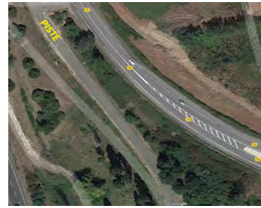
Piste d 'entrainement